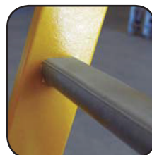
Detalle peldaño Détail marche Detalhe degraus