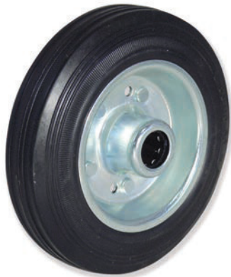
10-60/9 160 EGR5