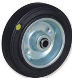
10-55/59 125 EGAB4