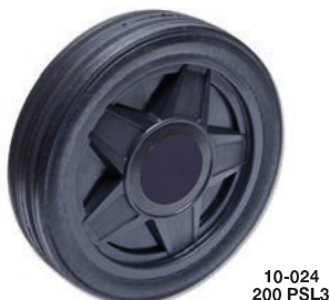
Ejemplo de rueda: