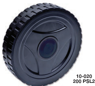
Ejemplo de rueda: