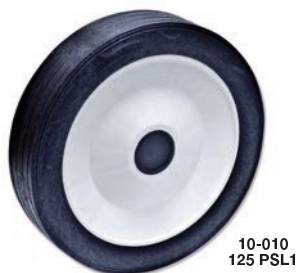
Ejemplo de rueda: