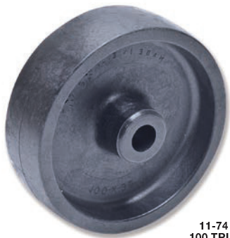
11-74 100 TPL4