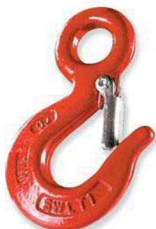
Gancho fijo Gancho fixo Crochet fixe