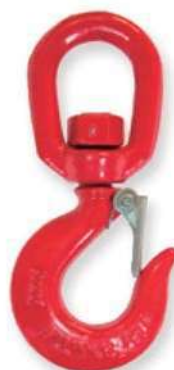
Gancho giratorio Gancho giratorio Crochet pivotante