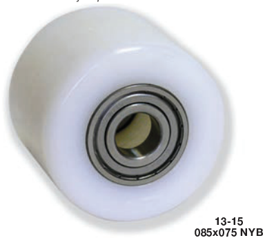
Ejemplo de rueda: