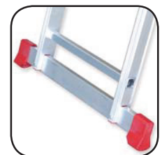
Detalle estabilizador Détail de stabilisation Detalhe estabilizador