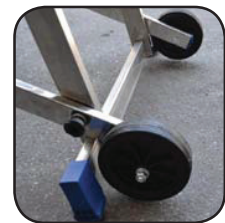
Detalle ruedas Détail roues Detalhe rodas