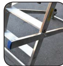
Detalle maneta de transporte Détail poignée de transport Detalhe alça de transporte