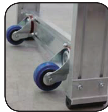
Detalle ruedas traseras Détail roues arrière Detalhe rodas traseiras