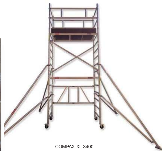
COMPAX-XL 3400 Pack (A+B+C+D+E)