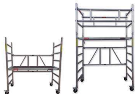
COMPAX-XL 1400 Pack (A)