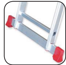
Detalle estabilizador Détail de stabilisation Detalhe estabilizador