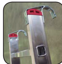
Detalle gancho opcional Détail crochet en option Detalhe gancho opcional