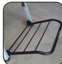
Detalle bandeja Détail plateau Detalhe bandeja