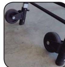
Detalle ruedas Détail roues Detalhe rodas