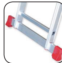
Detalle estabilizador Détail de stabilisation Detalhe estabilizador